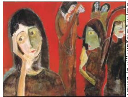
Kultursjukdomar är tillstånd som kanaliseras diffus sjukdomskänsla i en kulturspecifik kontext. Sjukdomsbilden förändras i takt med förändringar i samhällskulturen och den medicinska kunskapen. Historiska exempel från förra sekelskiftet är hysteri och neurasteni.

Psyko-terapeutiska metoder har visat goda resultat, vilket starkt talar för att psykosociala faktorer inte kan förbises i etiologiska sammanhang [15, 16]. An-